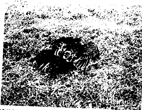
Individuos de Cathartes aura capturados el 03/12/2007